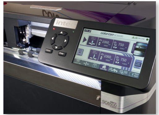
Intuitive Touchscreen-Steuerung und taktile Bedienoberfläche für einfache Bedienung