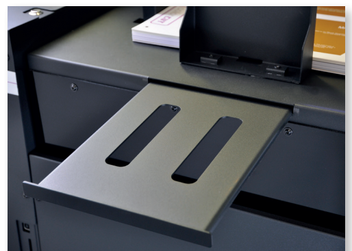
Für längere Medien kann das Anlagefach durch einen Auszug verlängert werden